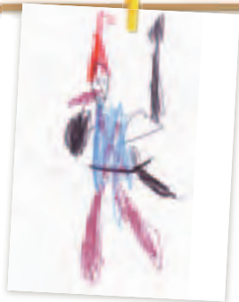
Cette armure est vraiment trop lourde pour le jeune berger