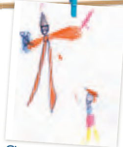
C'est en utilisant sa fronde qu'il atteint Goliath en plein front