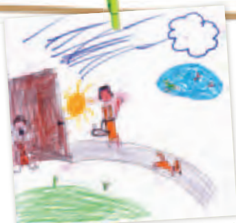
Pour ravitailler ses frères, qui en ont bien besoin, David leur apporte à manger sur le champ de bataille