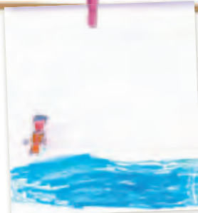
David choisit cinq pierres polies dans le torrent